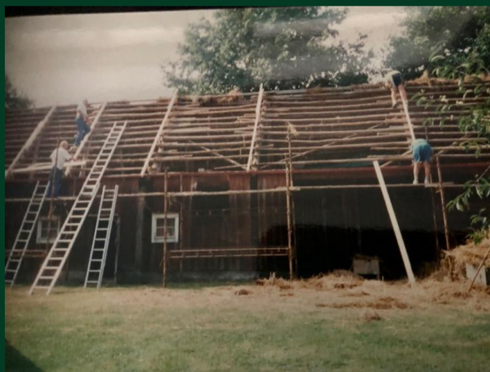
Taket på ladan renoveras